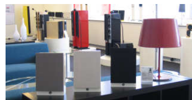
slap af i en sofa, mens du studerer de mange højttalertyper