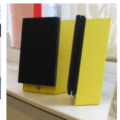
se eksempler på speciallakerede højttalere.