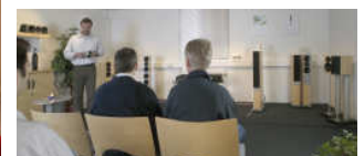
et af de to SA showrooms i Løgten, nær Århus