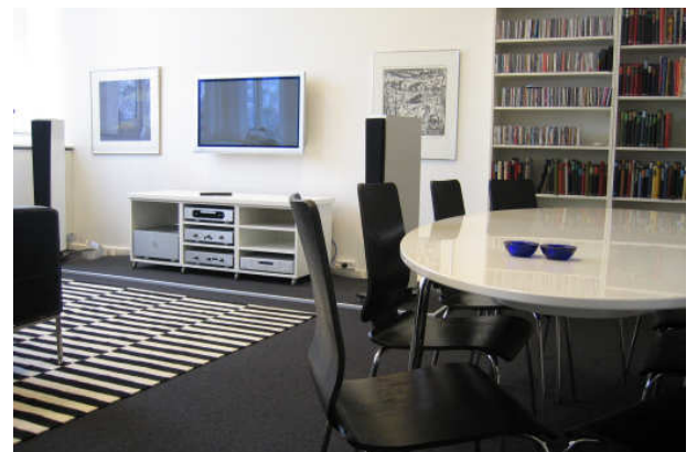
et demonstrationslokale indrettet som en rigtig stue. En anderledes og indlysende idé

Klik ind på www.system-audio.com . Under "forhandlere" finder du de butikker, der kan invitere dig til at besøge SA's showroom. Kontakt herefter en forhandler og aftal en dato.